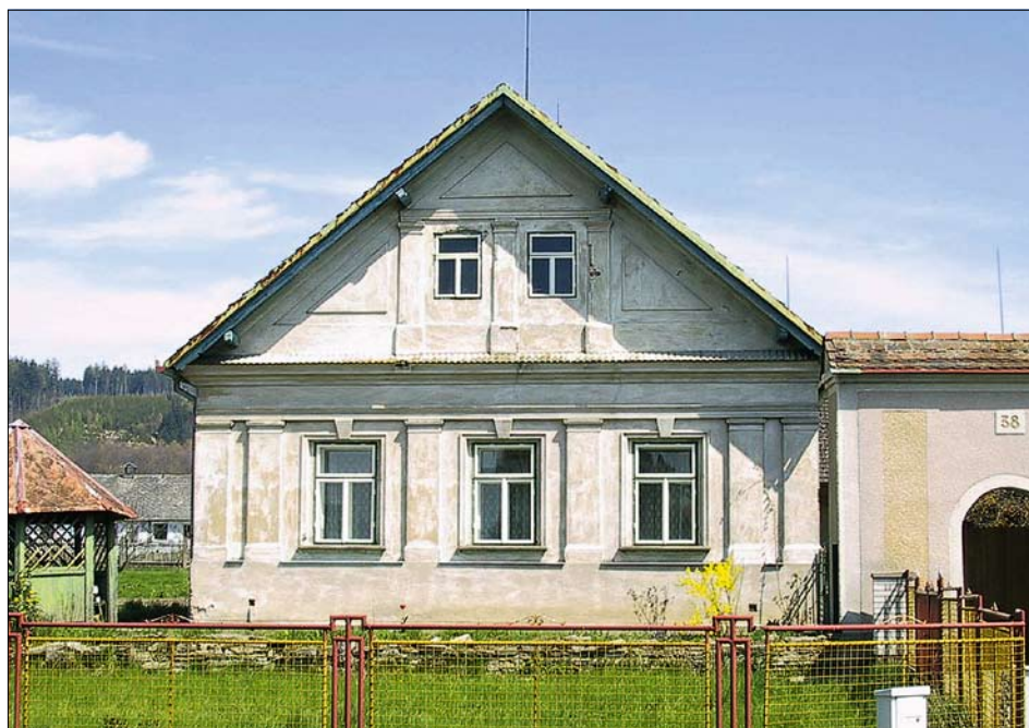
Obr. 13: Křivice, čp. 38, průčelí obytného domu (foto NPÚ, ÚOP v Josefově, P. Arjčuk, 2001).

hlavní obytná budova, v pootočené poloze špýchar a v zadní části parcely mírně posunutá stodola. V době údržby katastrální mapy evidenční před rokem 1940 bylo hlavní stavení propojeno se stodolou a ke špýcharu byl mezi lety 1875 a 1940 přistavěn výměnek. Vstup do usedlosti uzavírá kulisová brána.