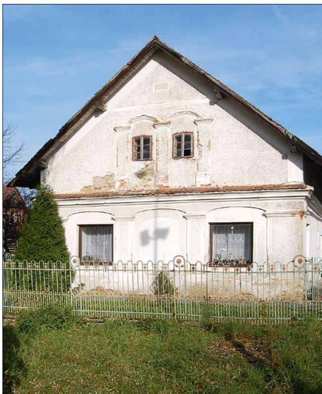
Obr. 17: Křivice, čp. 45, průčelí obytného domu.

na zadní straně stejně velká přístavba. V současné době existuje pouze hlavní objekt usedlosti.