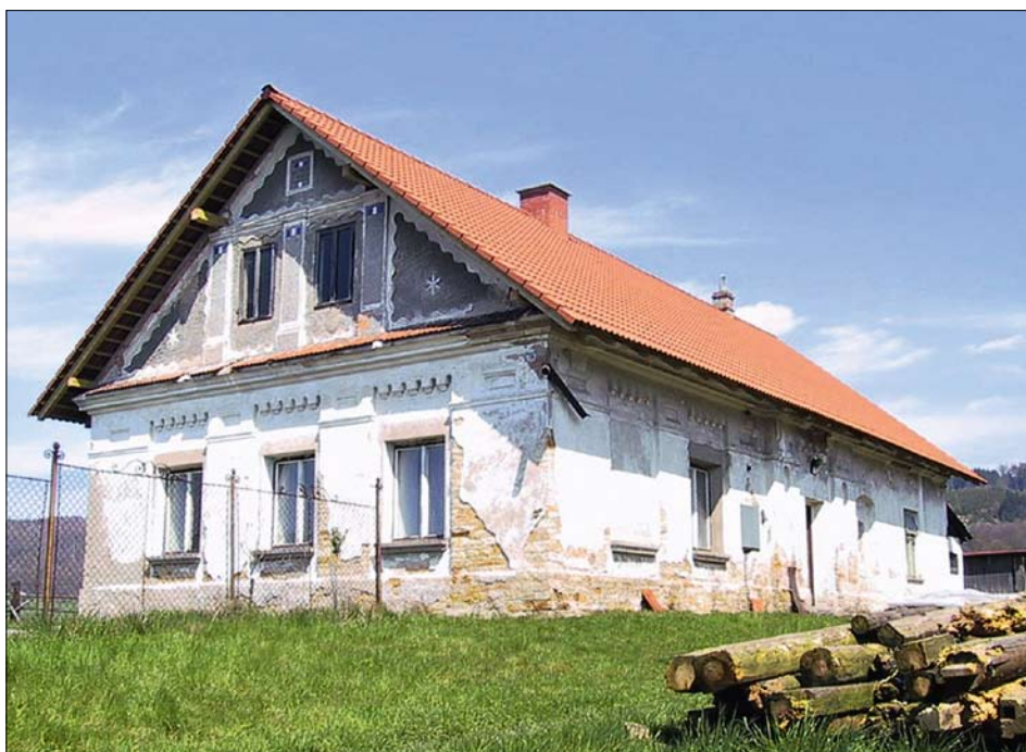
Obr. 11: Křivice, čp. 36, obytné stavení od jihovýchodu.

Hlavní obytná stavba vznikla po roce 1869, její mladší původ prozrazuje použití obloučkového vlysu na konzolkách. Brána podle použitého tvarosloví může být o něco starší. Zřejmě v roce 1920 došlo k úpravě oken a někdy ve 3. čtvrtině 20. století k jejich výměně. Další stavební zásahy proběhly po roce 2010.