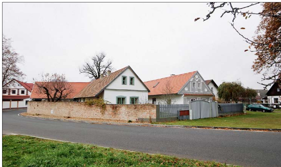
Obr. 18: Křivice, skupina drobných usedlostí na západní části návsi, uprostřed čp. 50.

Pro stavby v Křivicích (a obecněji na bývalém opočenském panství) je typické mělké řešení prvků bez výraz-