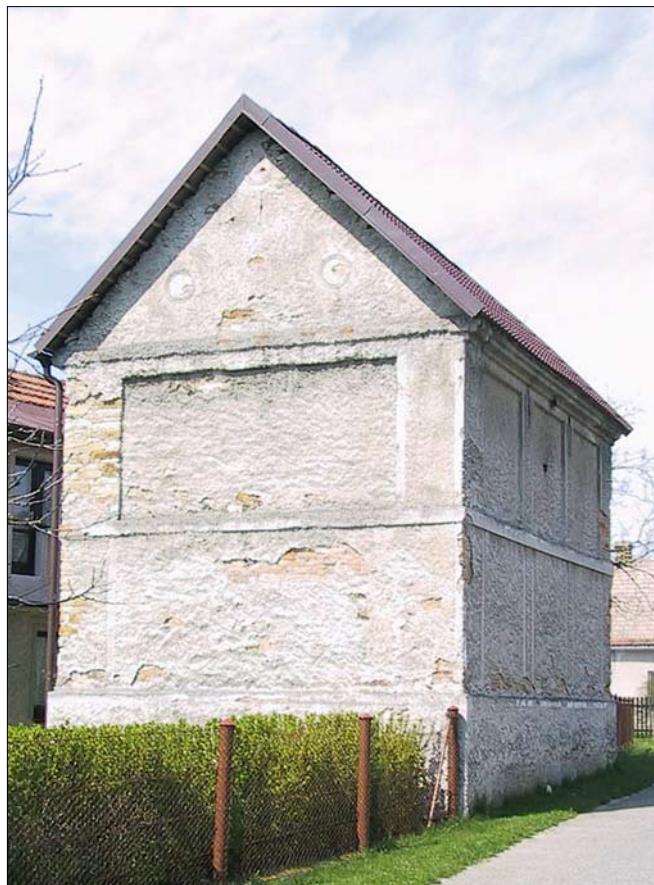
Obr. 8: Křivice, čp. 32, špýchárek od jihu (foto NPÚ, ÚOP v Josefově, P. Arjčuk, 2001).

Zatímco přízemí domu, vystavěného v roce 1862, 40) prošlo v průběhu 20. století úpravami, prakticky likvidujícími původní architektonické řešení včetně otvorů, hlavní štít se dochoval až do nedávné doby téměř v intaktním stavu. 41) Řešení průčelí bylo zřejmě shodné s čp. 41. 42)