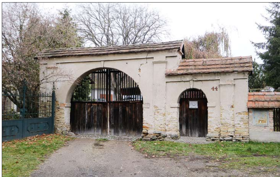
Obr. 21: Křivice, čp. 44, brána.

Tento článek vznikl v rámci plnění výzkumného cíle NPÚ Nemovité památky v ČR , financovaného z institucionální