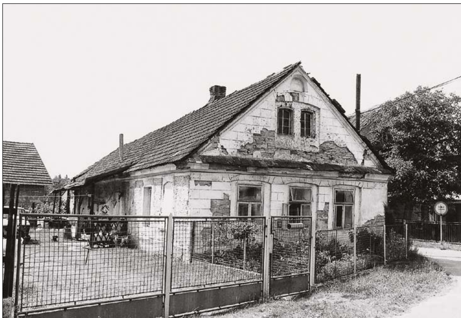
Obr. 4: Křivice, čp. 13 pohled na obytné stavení od severu (foto NPÚ, ÚOP v Josefově, V. Maryška, 1992).

je čtyřstranná usedlost s požárně bezpečným (zděným) obytným domem a u zadní brány kolmo k němu situovanou hospodářskou stavbou (špýcharem), před rokem 1875 prodlouženým o kůlnu. Dvůr paralelně s obytným domem vymezují na jihovýchodě požárně nebezpečná stodola a na jihozápadě kolmo ní situovaná drobná hospodářská stavba.