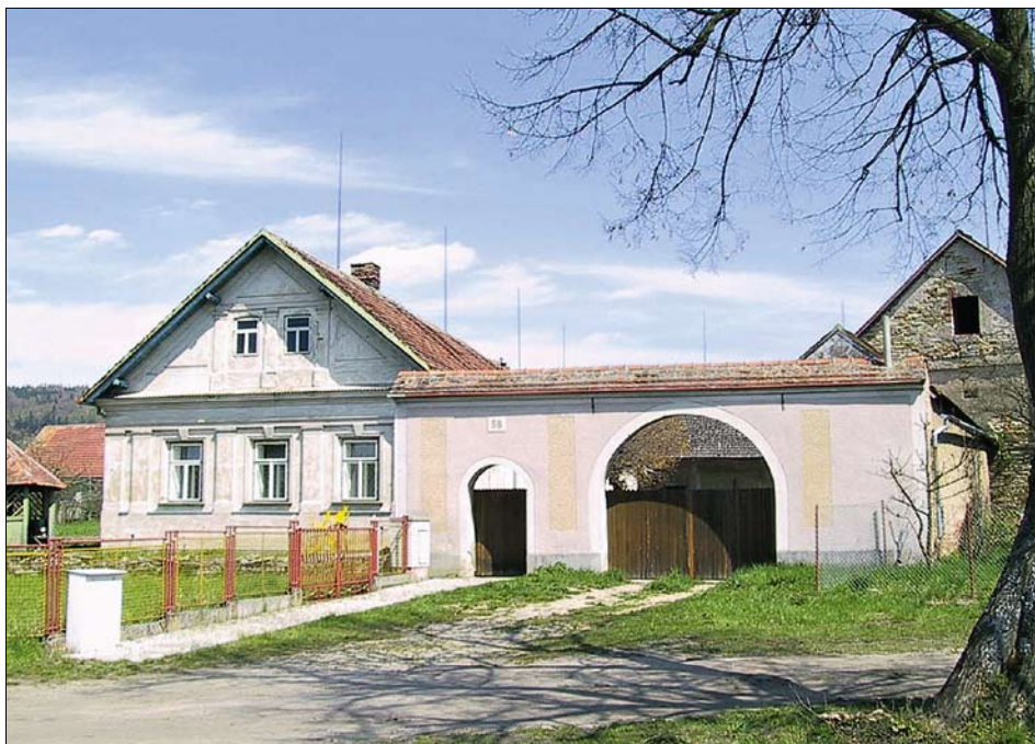
Obr. 12: Křivice, čp. 38, celkový pohled od jihu.