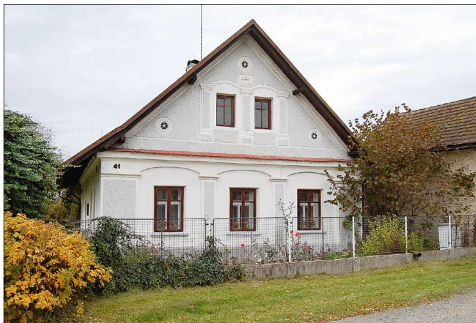
Obr. 15: Křivice, čp. 41, průčelí obytného domu.

Hlavní štítové průčelí je tříosé, osazené na vyšší sokl. Člení je slepá arkáda s mělkými pilastry, nízkými segmentovými oblouky a profilovanou korunní římsou krytou bobrovkami. Dřívky pilastrů pokrývá předstupující hrubší omítka světle šedé barvy. V orámovaném štítu dvojice oken vložená do arkády s pilastry spojenými segmentově vzduťnými římskami. Při vrcholech trojúhelného štítu stylizované kruhové větrací otvory, nad středovým pilastrem tabule s rámečkem a malovaným datačním nápisem