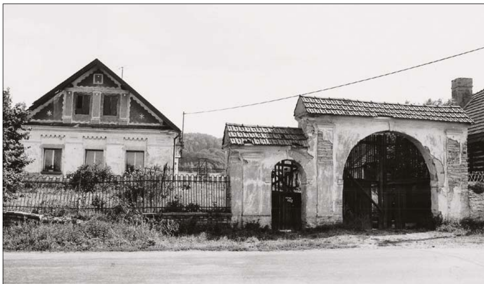
Obr. 10: Křivice, čp. 36, čelní pohled.

Průjezd brány i nižší vstupní branky ukončují půlkruhové záklenky se štukovými šambránami s klenáky. Nad mělkými pilastry s hlavicemi se vznášejí voutová hlavní římsa, na ní sedí sedlové stříšky kryté francouzskými taškami srdcovkami. Výplně byly dřevěné, rámové konstrukce, branka jednokřídlá, vrata dvoukřídlá, dole plně bedněné, nahoře lačkové. 47)