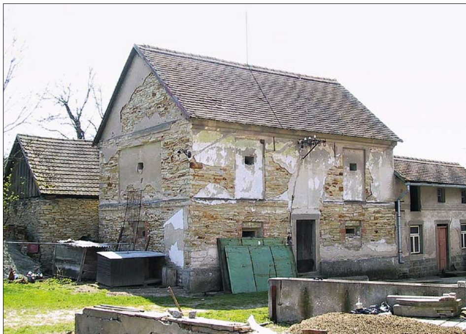
Obr. 14: Křivice, čp. 38, špijchárek od severozápadu (foto NPÚ, ÚOP v Josefově, P. Arjčuk, 2001).

Čp. 41 – menší usedlost stojí ve střední části vsi jako prostřední v dodatečné severní frontě návsi. Před rokem 1587 ji vlastnil Mikuláš Chocholouš. 49) Tvoří ji přízemní objekt orientovaný ve směru severozápad - jihovýchod s obytnou přední částí širší a vyšší než zadní. Podle map stabilního katastru stojí nynější stavba na místě starší dlouhé úzké budovy, prodloužené mezi lety 1840 a 1875 dále k severozápadu a ukončené východozápadně orientovanou půdorysně mohutnější budovou, zřejmě stodolou, a na západě navazující na podobný, ale kratší objekt v zadní části sousední, dnes již neexistující usedlosti čp. 40. Oba tyto objekty měly své předchůdce, orientované však kolmo na delší osu parcely.