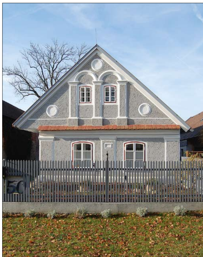
Obr. 19: Křivice, čp. 50, průčelí (foto NPÚ, ÚOP v Josefově, J. Tluchoř, 2017).

něji vysazovaných zubořezových a obloučkových vlysů, charakteristických v okolí Hradce Králové a Jaroměř. Použití odlišných způsobů výzdoby zřejmě dovoluje určit operační obvody jednotlivých zednických mistrů, ve velké míře kopírující před rokem 1848 rozsahy panství Opočno, Smiřice, Náchod a Broumov.