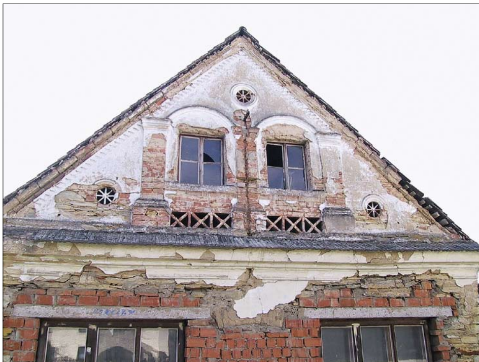
Obr. 6: Křivice, čp. 31, detail štítu (foto NPÚ, ÚOP v Josefově, P. Arijčuk, 2001).

Na štítovém průčelí obytného stavení bylo před poslední úpravou patrné, že prosvětlení dvojicí trojdílných oken vzniklo úpravou trojosého řešení s okny se segmentovými záklenky a hladce omítaným průčelím. Profilovaná hlavní římsa byla nasazena na drobné voutě s patečním obloučkovým profilem. Plochu dvuosého štítu s římsovým profilem po obvodu rozděluje dvuosá slepá arkáda s širokými pilastry a segmentovými oblouky, pod kterými se nacházela obdélná dvoukřídla dvoutabulová okna.