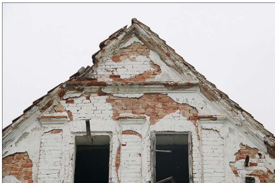
Obr. 3: Křivice čp. 1, vrcholová část štítu.

Posloupnost majitelů lze stanovit od roku 1587, kdy usedlost koupil Jan Šimek od svého otce za 152 a půl kopy českých grošů. 33) Obytný dům a hospodářská budova byly vystavěny kolem roku 1812 z nespalného materiálu. Usedlost vyhořela při prvním požáru Křivic v roce 1863 a byla obnovená. Při návsi byl před rokem 1869 postaven okapově orientovaný výměnek, přibližně tehdy došlo k výměně oken obytného objektu. Stodola zanikla krátce po roce 2004.