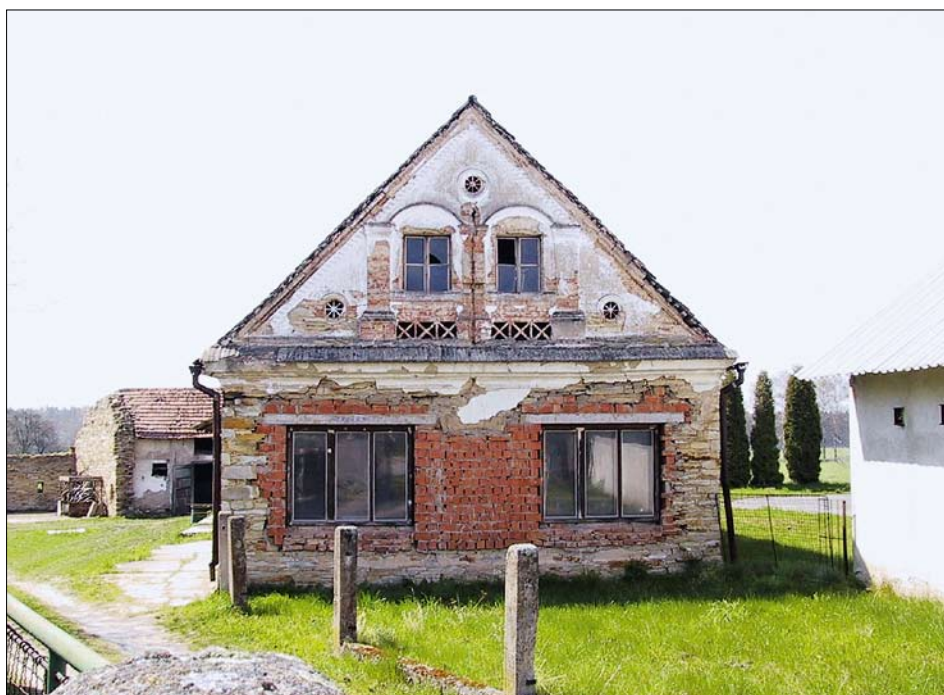
Obr. 5: Křivice, čp. 31, průčelí domu od severu.

Čp. 13 – malá usedlost stojí v jižním koutu návsi u cesty k Týništi nad Orlicí. Prvním známým majitelem je v roce 1573 Jiří Novotný. 35) V mapách stabilního katastru ji kromě hlavního obytného požárně bezpečného stavení na západní straně dvora tvořily dva požárně nebezpečné objekty – menší podélné stavení při východním okraji dvora, který z jihu napříč uzavíral východnější objekt, zřejmě stodola. V indikační skice je východní objekt nahrazen zahradou, v originální mapě je naopak východní objekt nově vzadu spojen s novostavbou příčného stavení a na severu se k návsi přikládá drobný nový objekt. Hlavní objekt je přízemní s pravou dispozicí se světnicí sklenutou dvojicí segmentových kleneb na stlačený pas, ve středním díle se ze síně (se strmým schodištěm na půdu) vstupuje