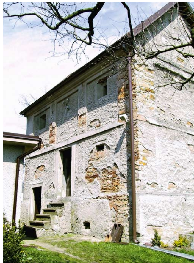
Obr. 9: Křivice, čp. 32, nádvorní strana špýcháru.