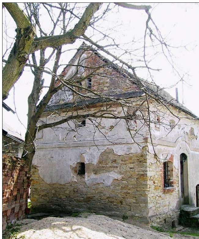
Obr. 7: Křivice, čp. 31, špýcharérek od severu.

Mezi sokly pilířků probíhal pás větráků složených z diagonálně dělených čtverců. Volné trojúhelné části štítu pročeňovaly kruhové větráky s diagonálním dělením na osm dílů. Obvod štítu lemuje jemný pásek se štukovými čabrakovými motivy. V polovině dvorního průčelí se nacházel zděný vikýř se segmentovým záklenkem vstupu a kruhovým okénkem pod nízkou sedlovou stříškou. Na průčelí poškozeném úpravami ve 20. století bylo možné