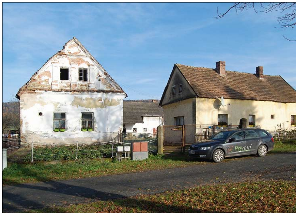
Obr. 2: Křivice čp. 1, celkový pohled od jihu.

Architektonicky pojednáno je pouze dvouosé štítové průčelí obytného domu. Přízemí rozčleňuje velmi široký lizénový rám a korunní římsa. Dvouosý štít s trojicí pilastrů s profilovanými patkami a hlavicemi obíhá masivní profilovaná římsa, pod vrcholem s vloženou vodorovnou římsou v úrovni hambalků. Pilastry nebyly podle všeho spojeny štukovou římsou, mezi nimi jsou vsazena obdélná okna v líci, zřejmě dvoukřídlá podle jediného dokumentovaného trojtabulového křídla. Podélné dvorní průčelí je řešené jednoduše s okenními a dveřními otvory a korunní římsou. Zásep nikdy nepřekrýval přesah střechy.