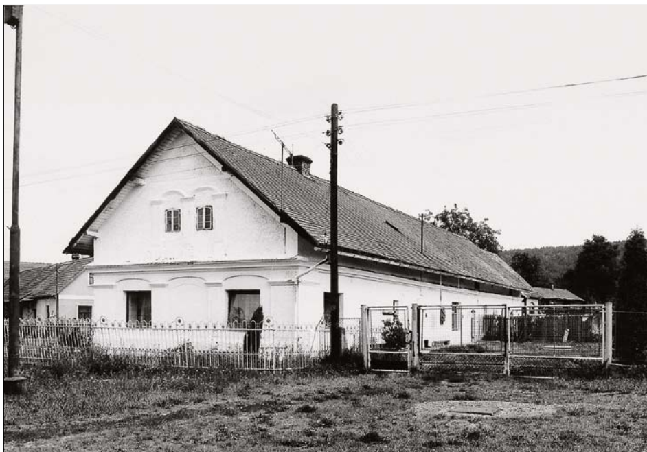
Obr. 16: Křivice, čp. 45, celkový pohled na obytný dům od jihovýchodu.