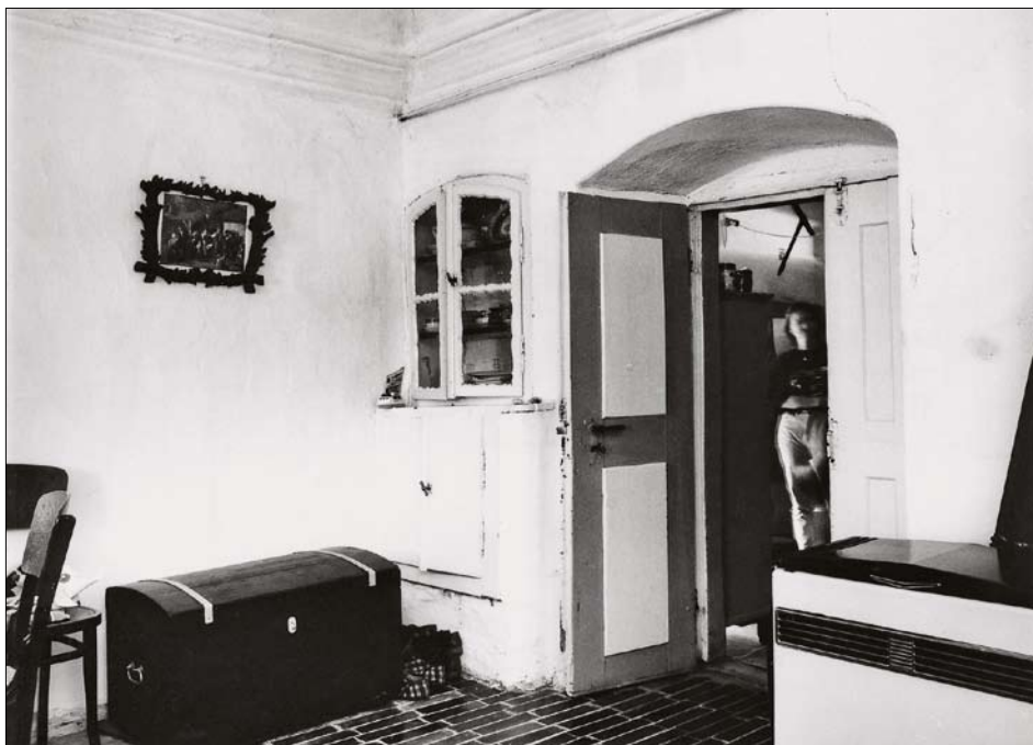
Obr. 20: Křivice, čp. 50, vstupní část světnice.

mů) ani změny staveb po roce 1875 s charakteristickými podkrovními polopatry s nezbytnou náhradou krovu. Velice přínosné bude v budoucnu porovnání změn zástavby v dalších obcích regionu, především na Královéhradecku a Jaroměřsku, zejména u obcí postižených většími požáry, případně válečnými událostmi roku 1866 (kde však ponížení palbou a následnými požáry nebylo příliš závažné).