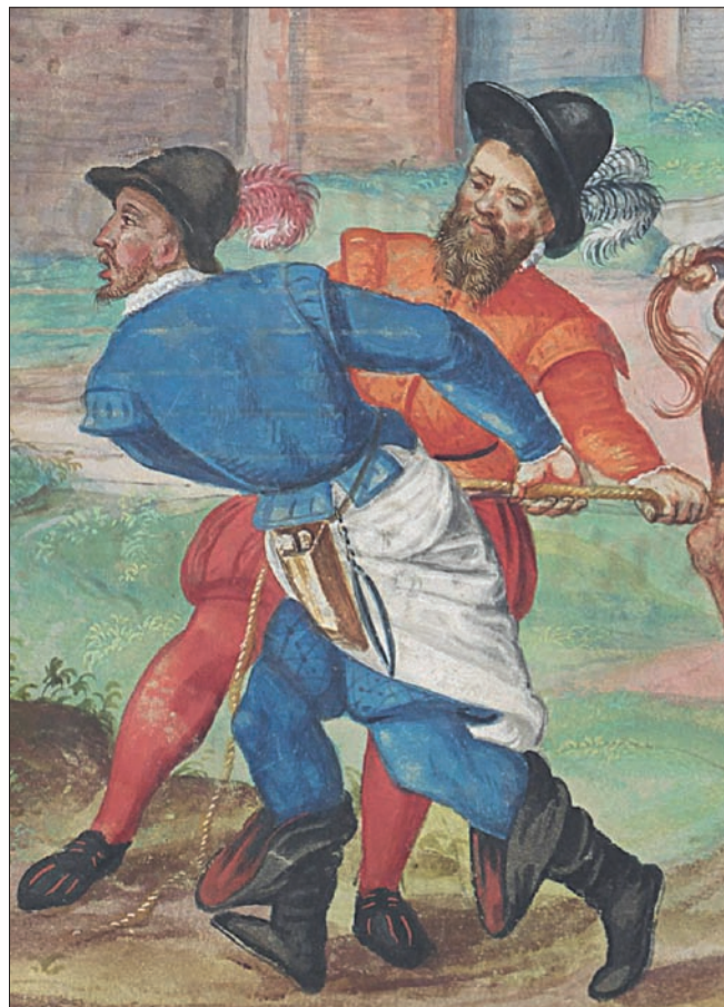
Obr. 19: Detail scény porážky s dvojicí řezníků, knižní malba. Malostranský graduál, 1572, fol. 22v, výřez (Národní knihovna České republiky).

Překřížené širočiny nacházíme na plášti závěru kostela sv. Jakuba většího v Olbramovicích (okr. Znojmo). Obdélná reliéfní deska z pískovce je značně zvětralá, ornamentální