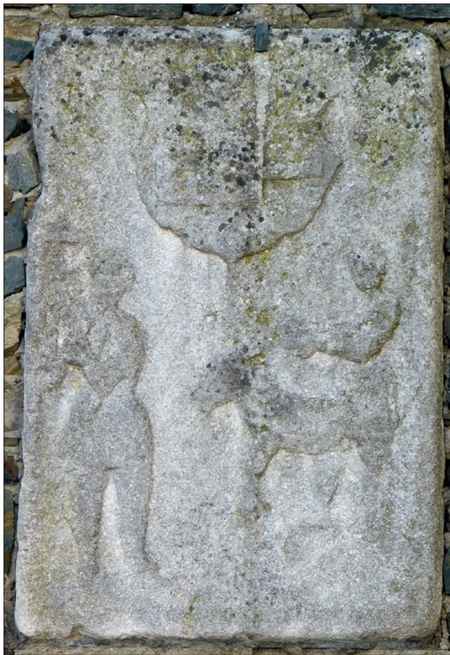
Obr. 6: Hostěradice (okres Znojmo), bývalá komenda řádu německých rytířů, fasáda středověké věžové stavby, vápencová reliéfní deska s vyobrazením porážky a znakovým štítkem.

V této souvislosti lze zmínit fakt, že na řadě dalších soudobých zobrazení porážky je dobytče drženo přímo za rohy, dokladem může být kupř. rytina Josta Ammana z roku 1568 ( Der Metzger ) s řezníkem a jeho pomocníkem ze série Ständebuch ; na podlaze leží mj. sekáček a oba muži mají zavěšeny u pasu typické řeznické toulce tvaru protáhlého kornoutu se dvěma noži. Stejnou situaci můžeme předpokládat na ojedinele zachované nástěnné malbě porážky v podloubí domu čp. 62 na náměstí Míru v Domažlicích, byť je toto pozdně gotické dílo zachováno značně neúplně. Scénu tvoří tři postavy a dobytče; zleva opět rozkročený řezník s napraženými rukama se sekyrou, hlavu zvířete (zaniklou) drží pomocník, jehož poloha rukou odpovídá natáčení hlavy za rohy. Třetí figura vzadu na pravé straně drží v pravici větévku, jde asi o znázornění pobízení, nahánění; ve stejné ploše pasu, v jeho pravé polovině, je namalována tzv. malá Kalvárie. Kombinaci úkonů – držení za rohy a současně znehybnování hlavy pomocí silného provazu – představuje zmíněný výjev ve Žlutickém kancionálu; někdy je omračované dobytče dr-