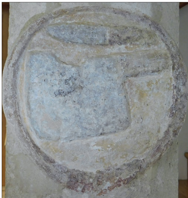
Obr. 14: Znojmo, Horní náměstí, dům čp. 139, kamenný sloup v průjezdu, detail se symboly řeznického řemesla v kruhovém medailonu.

vedle výše popsané reliéfní desky na průčelí nalezneme v přízemní síni domu sloup s kruhovým terčem vyplněným polychromovaným reliéfem nože a sekáčku (obr. 14). Reliéf není datován přímo, na polygonálním (okoseném) dřívku sloupu, jehož je součástí, jsou však zachovány vysekané číslice 5 a 4. Tato řemeslnická prezentace by tedy vznikla o čtyři roky později než letopočtem 1550 opatřený reliéf na fasádě. Přijmeme-li toto datování, jde v regionu o druhý nejstarší datovaný reliéf se symboly řeznického řemesla v jednoduché podobě, tj. bez figurální složky. Umístění řemeslnické reprezentace uvnitř domu je ojedinělé.