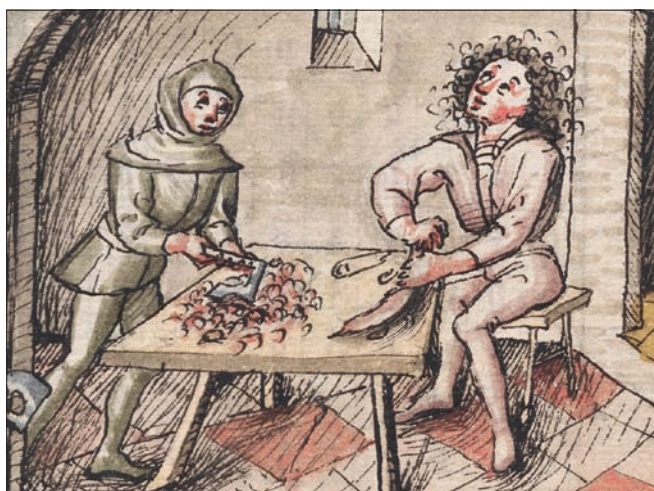
Obr. 23: Scéna zabijačky, knižní malba. Iatromathematisches Hausbuch , 1475, fol. 11r, výřez (Österreichische Nationalbibliothek, Cod. Nr. 3085).

pramenech doby pozdní gotiky, resp. renesance, kupř. na knižní malbě zabijačky prasete ( Schweineschlachten ) v rukopisu z 3. čtvrtiny 15. století (obr. 23). 102) Jde o alegorii měsíce prosince, na níž jsou mj. zachyceny dvě figu-