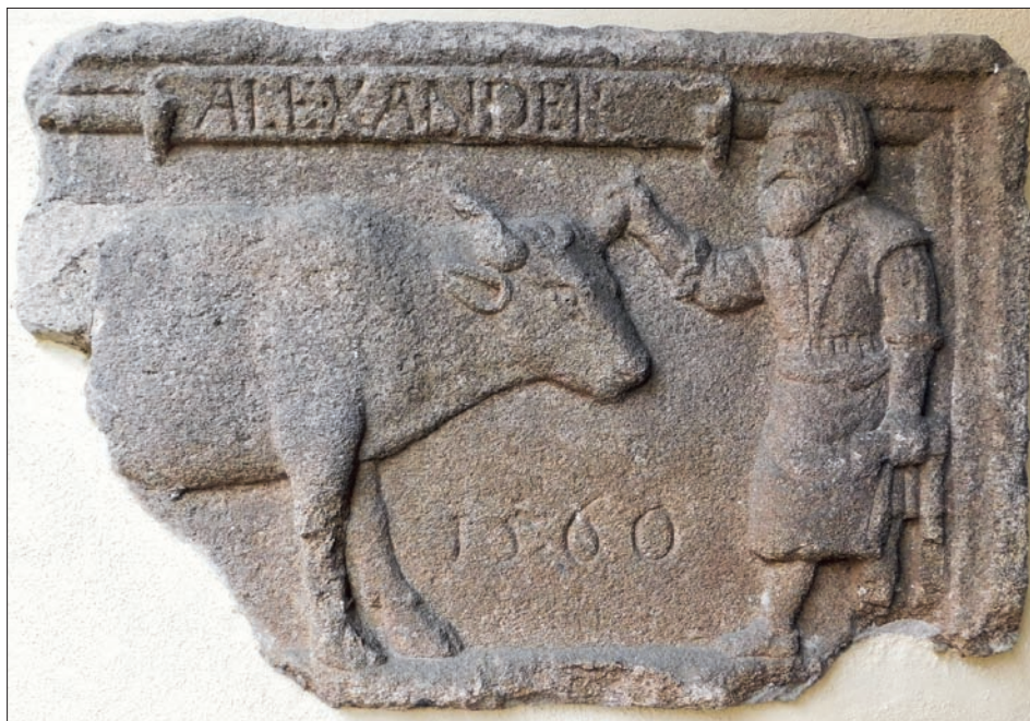
Obr. 4: Moravské Budějovice (okres Třebíč), areál bývalých masných krámků, vnitřní strany ohradní zdi, pískovcová reliéfní deska řezníka Alexandra (není-li uvedeno jinak, všechna foto Z. Vácha).

K veskrze reprezentačním reliéfům patří vápencová deska řezníka Františka umístěná druhotně ve zdi