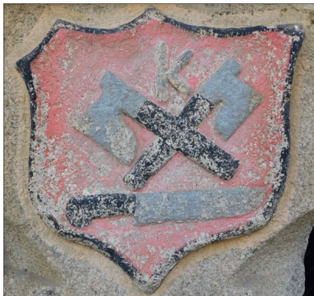
Obr. 15: Telč (okres Jihlava), náměstí Zachariáše z Hradce, dům čp. 8, žulový sloup podloubí, detail se znakovým štítkem obsahujícím symboly řeznického řemesla.