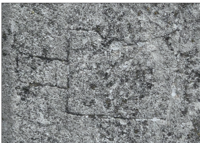
Obr. 11: Mícmanice (okres Znojmo), torzo vápencových božích muk dnes druhotně sloužící jako sloupek sochy sv. Floriána, detail dřívku sloupku se sekáčkem, symbolem řeznického řemesla.

s předpokládanou datací do 1. poloviny 16. století, ze kdy pochází většina zachovaných božích muk závěrečného stadia gotiky na jižní Moravě. 78)