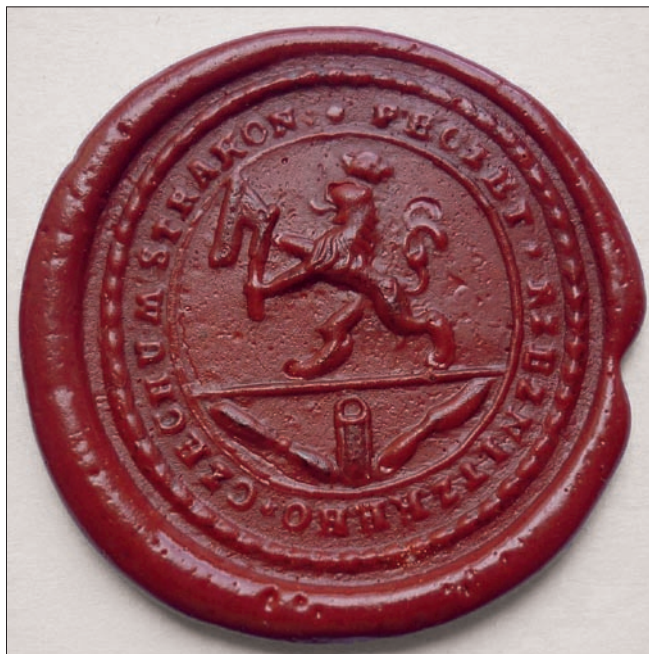
Obr. 21: Pečeť strakonického cechu řezníků.