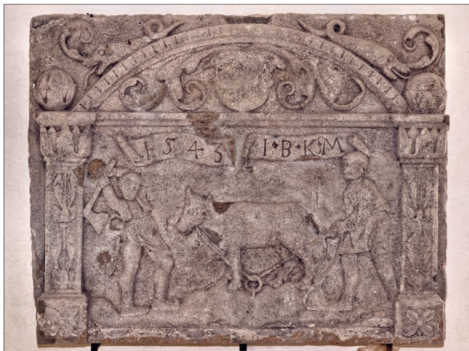
Obr. 2: Znojmo, vápencová reliéfní deska znojemského řeznického cechu (lapidárium Jihomoravského muzea ve Znojmě).