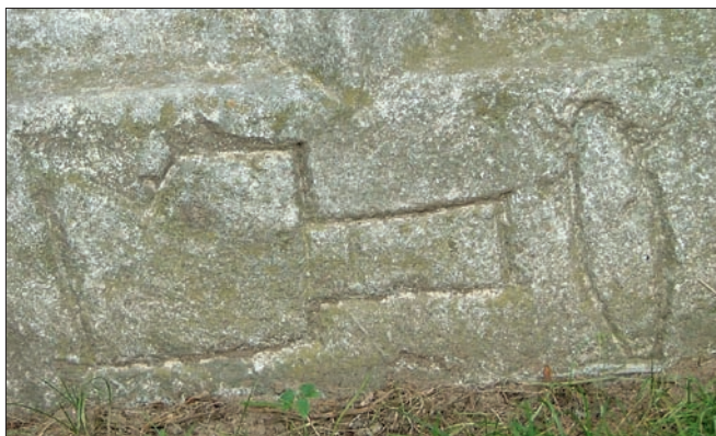
Obr. 10: Nový Šaldorf – Sedlešovice (dnes součást Znojma), vápencová boží muka, detail patky sloupku se symboly řeznického řemesla.