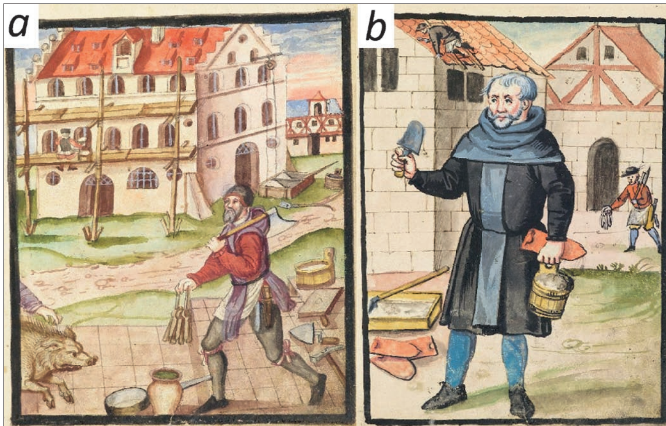
Obr. 25: Postavy řezníků, knižní malba. A – Schweinestecher Hans Layer, 1586; B – Schweinestecher Albrecht Meixner, 1599. Obojí Hausbücher der Nürnberger Zwölfbrüderstiftungen (Stadtbibliothek im Bildungscampus Nürnberg; A – Mendel II, Amb. 317b.2° fol. 46r; B – Mendel II, Amb. 317b.2° fol. 64r).