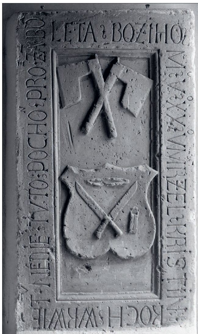
Obr. 9: Prostějov, kostel Povýšení sv. Kříže, jihozápadní předsíň, pískovcový náhrobník řezníka Kristiána Kocha.