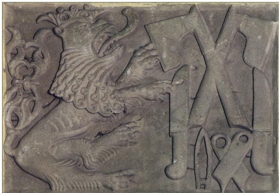
Obr. 20: Chrudim, kostel sv. Kateřiny, jižní boční loď, kamenný reliéf se symboly řeznického řemesla (foto A. Fládr).

valy dvoudílné i třídílné a jsou rovněž ve výtvarných dílech poměrně hojné. Z Nového Bydžova je v souvislosti s ocílkou dochována zpráva o zvyku odehrávajícím se o Bílé sobotě – řezníci tlukou na ocítku , aby měli dost odběratelů v tom roce; 84) typ ocítky však není znám. Zobrazení ocítky v poněkud odlišné podobě, byť vycházející opět ze základního vřetenovitého tvaru (obrysu čočky), nacházíme na kamenném reliéfu se snad vůbec nejbohatším kompozicí symbolů řeznického řemesla v českých zemích. Je jím reliéf na kruchty pozdně gotického kostela sv. Kateřiny v Chrudimi (obr. 20). Dnes je sekundárně osazen ve zdi jižní boční lodi.