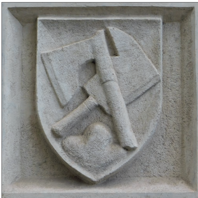
Obr. 17: Brno, Zelný trh, budova Reduty čp. 313, hlavní průčelí, kamenná reliéfní deska se znakovým štítkem obsahujícím symboly řeznického řemesla.