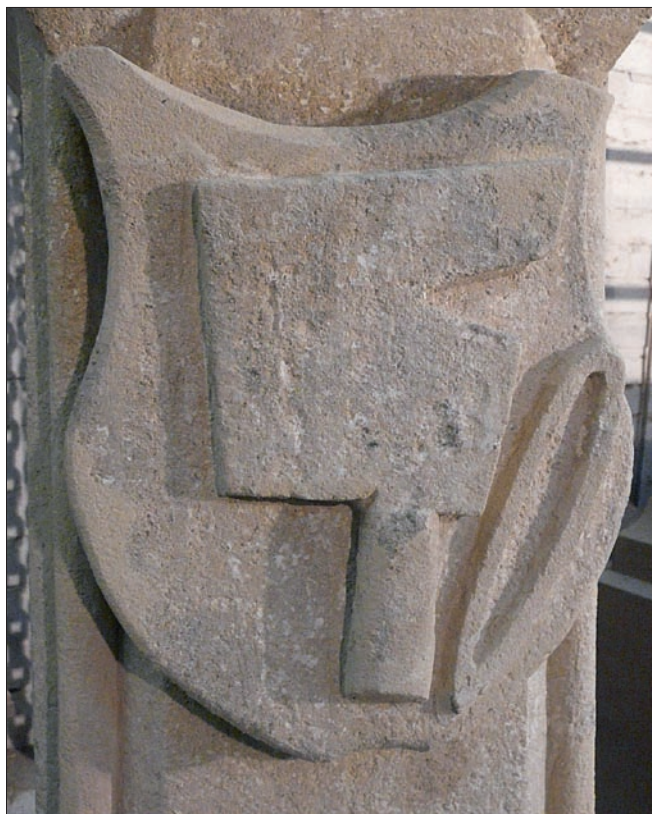
Obr. 12: Dyjákovice (okres Znojmo), vápencová boží muka, detail se znakovým štítkem obsahujícím symboly řeznického řemesla (foto v průběhu restaurování v dílně).