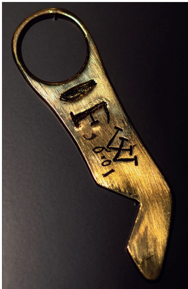
Obr. 24: Slučka, mosaz, datace 1601 (Germanisches Nationalmuseum Nürnberg, inv. č. Z 1).

pramenech doby pozdní gotiky, resp. renesance, kupř. na knižní malbě zabijačky prasete ( Schweineschlachten ) v rukopisu z 3. čtvrtiny 15. století (obr. 23). 102) Jde o alegorii měsíce prosince, na níž jsou mj. zachyceny dvě figu-