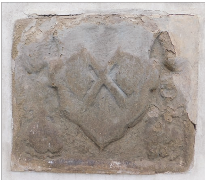
Obr. 18: Olbramovice, kostel sv. Jakuba většího, fasáda presbytáře, kamenný reliéf se znakovým štítkem obsahujícím symboly řeznického řemesla.

kříženy sekyra a sekáček (obr. 17). Jeho stáří nedokážeme určit, dle formálních analogií i podoby nástrojů však nelze vyloučit vznik i v 16. století. Deska je vyhotovena z krinoidového vápence ze Stránské skály u Brna, mimořádně odolné horniny zpracovávané pro architektonické, méně již pro kamenosochařské články (kupř. pozdně gotická Židovská brána) už ve středověku, kdy v Brně zcela převažovala. 82) Dnešní umístění může mít vysvětlení v lokalizaci zaniklých Masných krámů (demolice 1891), z nichž by reliéf mohl pocházet, v bezprostředním sousedství Reduty.