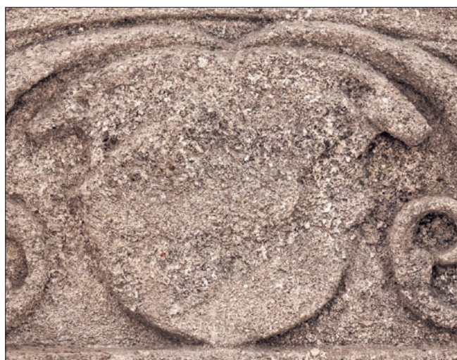
Obr. 3: Detail reliéfu na obr. 2, znakový štítek.