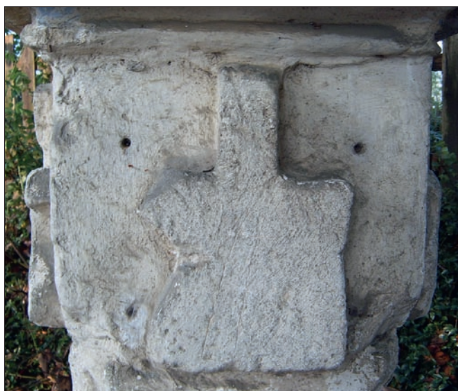
Obr. 13: Drozdovice (Drosendorf, Dolní Rakousy), vápencová boží muka, detail hlavičky dřívku se symbolem řeznického řemesla.

v Drozdovicích (Drosendorf v Dolních Rakousích), kde tzv. Fleischhackermarterl má na hlavičce tordovaného dřívku pod lucernou štítku s výrazným schematickým reliéfem sekáčku dokonce ze všech čtyř stran (obr. 13). Otevřenou otázkou proto zůstává, zda došlo u božích muk v Sedlešovických a Mícmanicích k dodatečnému vysekání řemeslnických symbolů. Ty by tudíž nebyly součástí původního záměru, nýbrž by přibýly kupř. při nějaké opravě božích muk podporované řezníky.