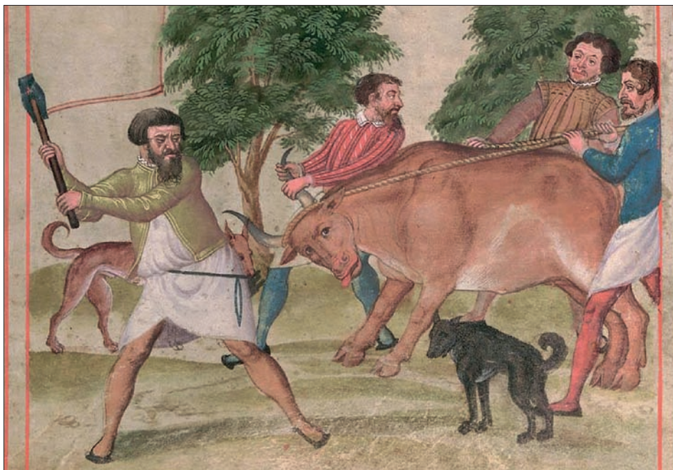
Obr. 1: Scéna porážky, knižní malba. Žlutický kancionál, 1558, fol. 0184v, výřez (Památník národního písemnictví).

v pohybu vzadu. Součástí scény jsou i dva psi. Zevrubný popis způsobu porážky odpovídající námi analyzovaným zpodobením pochází ještě z konce 19. století. 50)