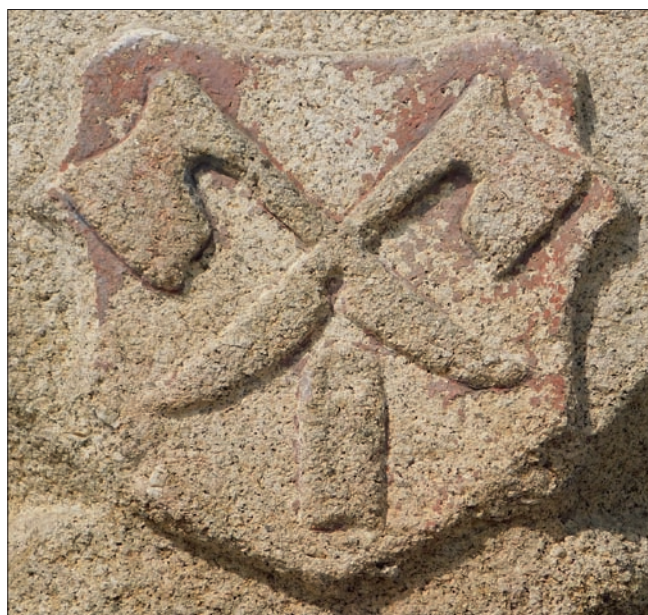
Obr. 16: Telč, náměstí Zachariáše z Hradce, dům čp. 64, žulový sloup podloubí, detail se znakovým štítkem obsahujícím symboly řeznického řemesla.

do svého držení řezník Jiřík Brázda spolu s masným krámem v roce 1551, 81) někdy poté tedy vznikl opět žulový štítek na sloupu podloubí, jenž je co do ikonografie u nás ojedinělý (obr. 16). Překřížené řeznické širočiny jsou totiž překryty v části topůrka noži a vzniká tak jeden útvar. Čepele směřující ostřím dolů tvoří jeho spodní část, pod sekerami je v ose štítku slučka. Oba dochované znakové štítky z Telče jsou poměrně hrubě provedeny v nízkém reliéfu, což je dáno žulou, tzn. těžko kamenicky opracovatelným materiálem.