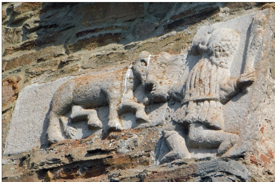
Obr. 7: Pernštejn (okres Brno-venkov), hrad, fasáda hranolové věže, mramorová reliéfní deska s motivem z rodové legendy Pernštejnů.

Zároveň je u vzhledu erbovního zvířete zřejmá snaha o jeho odlišení od skotu domácího. Heraldické památky nasvědčují po staletí takovému přímému zadání. Předně byla hlava zubra na malířských dílech prakticky vždy černá (kupř. Desky zemské brněnské 1480, 1506 a 1558) a zdůrazněno je větší osrstění divokého tura. Toto zvýraznění se projevuje jasně, např. na erbu Viléma z Pernštejna z roku 1480 (Desky zemské brněnské) v podobě odstávajících pramenů chlupů, černá hlava je, a nejen zde, výrazně kosmatá. U sochařských prací je pak rozrůznění zvýrazněno „čupřinou“ na čele zvířete, ať už obrysovou vlnkou, například na náhrobním kameni Jana II. z Pernštejna († 1475) v doubravnickém pohřebním kostele Povýšení sv. Kříže, nebo reliéfním provedením. To může být schematické, v podobě čar (např. náhrobní kámen Vratislava I. z Pernštejna, † 1496, v Doubravníku; litomyšlská deska s rodovou pověstí na domě čp. 117 na Smetanově náměstí), nebo více naturalistické s kadeřemi (zvíře na reliéfu na portálu kostela sv. Bartoloměje v Pardubicích z roku 1519, náhrobní deska Jana z Pernštejna † 1548 v Doubravníku a svorník klenby kostela tamtéž i mnoho dalších). Zubr vedený bájným předkem rodu na reliéfu z hradu Pernštejna však tento atribut postrádá.