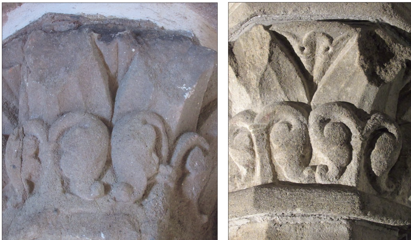
Obr. 13: Dekor hlavic ve vzájemném srovnání. Vlevo – Letovice, zámek; vpravo – Třebíč, klášterní bazilika, hlavice třetího sloupu od západu v severním sloupořadí lodi krypty.

tech 1233 a 1234 byl současně purkrabím na Hradci nad Moravicí, nejpozději od října 1234 po celý rok 1235 přešel jako purkrabí přímo do Olomouce, aby se následně roku 1236 vrátil zpět coby purkrabí na Hradec. V dnes známých písemnostech lze Voka zastihnout naposled krátce před 16. říjnem 1239; absence v dokladech čtyřicátých let 13. věku svědčí pro jeho úmrtí záhy po tomto datu. 26)