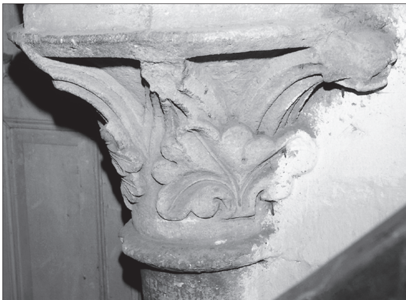
Obr. 7: Hradiště nad Jizerou (okres Mladá Boleslav), zaniklý cisterciácký klášter. Hlavice klenební přípory na rozhraní severního ramene transeptu a chóru konventního kostela Panny Marie (foto P. Kroupa, 1982; k tisku upravil M. Filip).