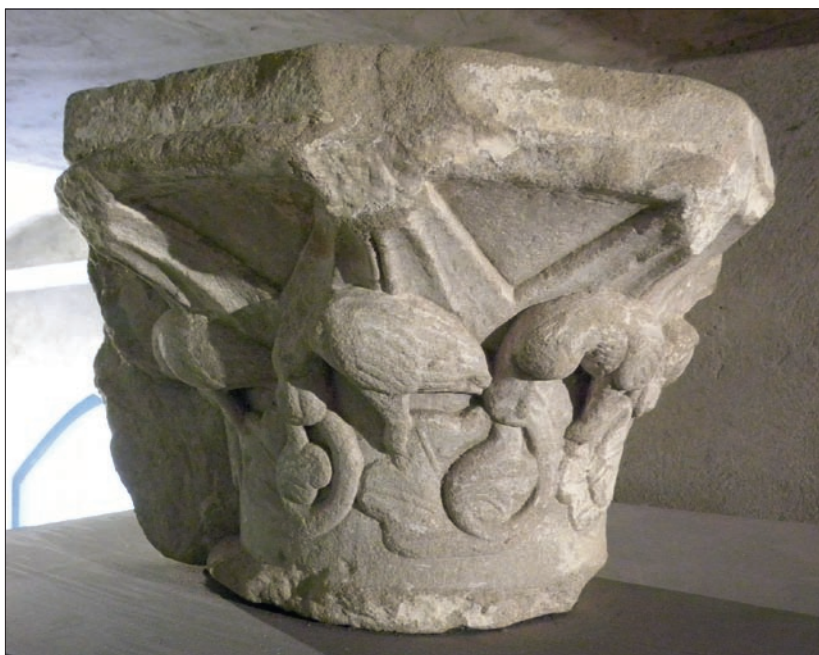
Obr. 8: Velehrad (okres Uherské Hradiště), bývalý cisterciácký klášter. Hlavice klenební přípory z ambitu, nyní v klášterním lapidáriu (inv. č. 5 819 LV).

ho křemene o průměru převážně pod 2 mm, jen výjimečně i nad tuto hodnotu. Podstatně méně jsou v materiálu hlavice zastoupeny drobnější úlomky černých hornin, pravděpodobně kulmského stáří, přítomnost novotvořeného glaukonitu nebyla pozorována, magnetická susceptibilita je velmi nízká. Všechny tyto znaky svědčí pro svrchně křídové stáří pískovce, konkrétněji zařaditelného do sladkovodního cenomanu perucko-korycanského souvrství (perucké vrstvy). Jako pravděpodobné se jeví využití určitého blízkého lokálního zdroje; nejbližší výskyty uloženin sladkovodního cenomanu vystupují v okolí Vanovic, 7,5 km severovýchodně Letovic. Ještě bližší cenomanské sedimenty se nacházejí v prostoru Třebětína, Kladorub a Vísek, ve výšce 2–5 km severně až východně od Letovic;