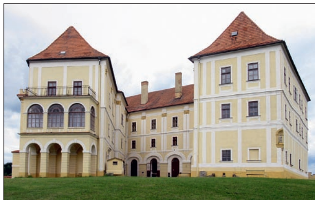
Obr. 1: Letovice (okres Blansko), zámek. Jádru zámku v pohledu od jiho-východu (není-li uvedeno jinak, všechna foto J. Doležel, květen až říjen 2025).

Klíčová slova: středověk – nejranější gotika – bobulová hlavice – Morava – letovický hrad – trebičská klášterní huť