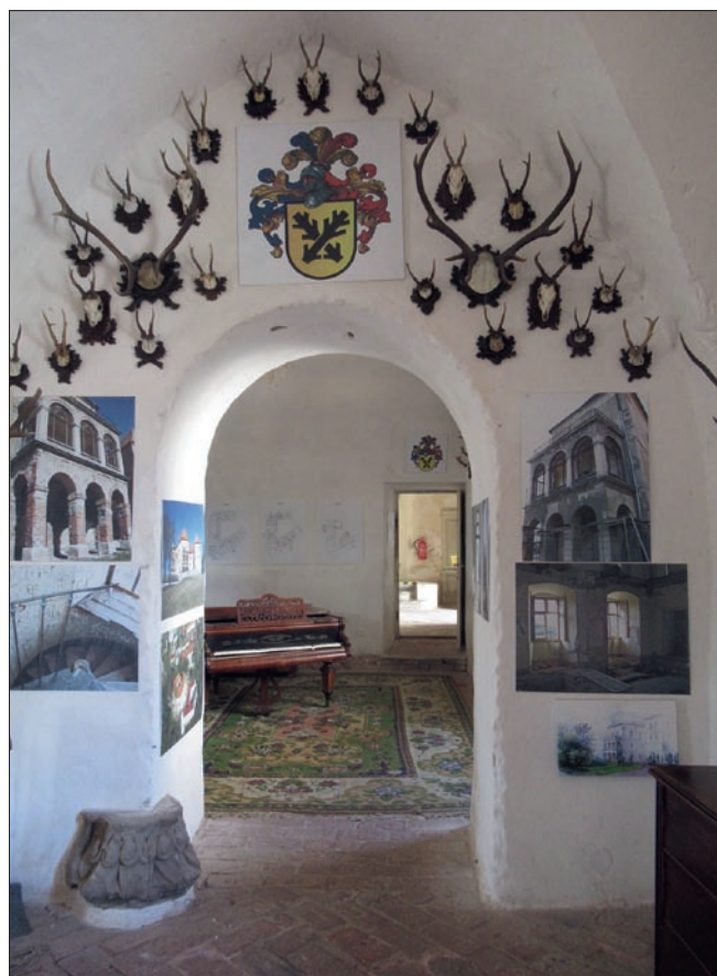
Obr. 3: Letovice, zámek. Nynější umístění raně gotické hlavice v patě levého (jižního) nároží prostupu v interiéru jihovýchodního křídla zámku.

ku fragment zaznamenal, byla zazdívkva v jeho bezprostředním okolí evidentně nedávného data. Podle vyjádření současného vlastníka Bohumila Vavříčka se hlavice při převzetí objektu roku 2004 již nacházela (volně uložena) v první, nejjižnější přízemní prostora jihozápadního palácového traktu, kam mohla být přenesena z místa nálezu v areálu zámku při předchozích rekonstrukčních pracích. 10) Do úvahy přitom připadají zejména poměrně rozsáhlé terénní výkopy, od roku 1988 periodicky prováděné v různých etapách obnovy celého zámeckého komplexu, zvláště při statickém zabezpečení západní kruhové věže (1998) a při zajištění kleneb jízdárny, konírny a přilehlých sklepění před jihozápadním čelem hradního jádra v letech 1999–2002. 11) Druhou eventuality zůstává vyzdvižení ze sekundární polohy v samotném zdivu či v odstraňovaných zazdívkách některé ze zámeckých budov, opět v souvislosti se sa-